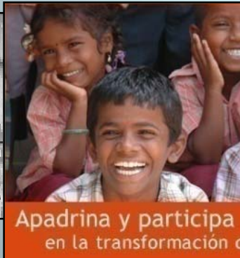
FUNDACIO VICENÇ FERRER